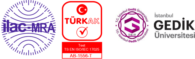
Şekil 2: İGÜN-Gedik Test Merkezi Akreditasyon Markaları